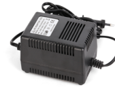
AC24V / 3A電源アダプタ